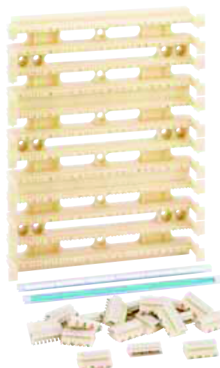
6 339 28

Pode ter mais tomadas de pares de cobre e de fibra e menos de coaxial e vice-versa. Como os produtos são modulares compomos de acordo com a nossa necessidade. Ocupa menos espaço.