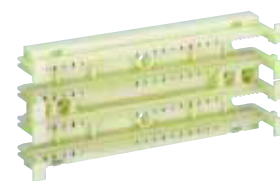
6 339 70