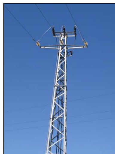
(Transição Aérea Subterrânea para o PTS)

Potência Instalada no Dolce Vita Douro (Públicos + Particulares) 9,7 MVA