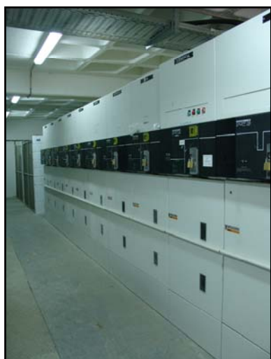
(Celas SF6 de Média Tensão)