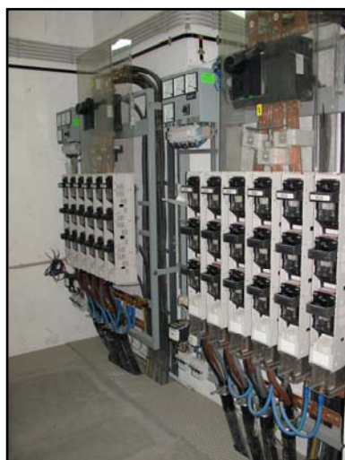
(Quadros de Baixa Tensão)