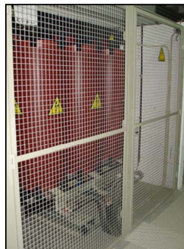
(Transformador Seco 30kV 630kVA)