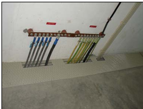
(Terra de Serviço e Protecção)